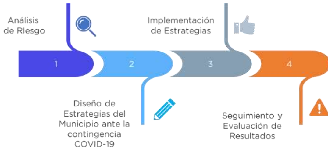
Figura 1. Plan de Trabajo

En esta sección se presenta un esquema del Plan de trabajo que se realizó para dar seguimiento a los efectos causados ante la contingencia COVID-19 en el Municipio: